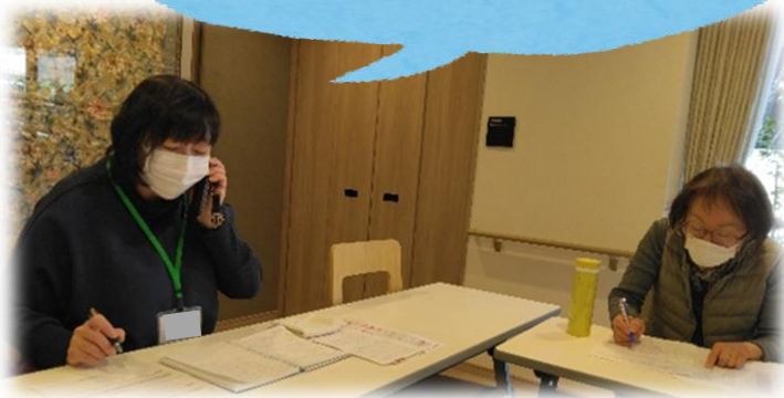
チャームプレミアグランド池田山会場

聞き上手な支援員さんのやり取りで 月1回の電話を心待ちにされる ご利用者様がいらっしやいます 😊