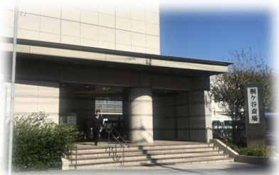
桐ヶ谷斎場 (西五反田5丁目)