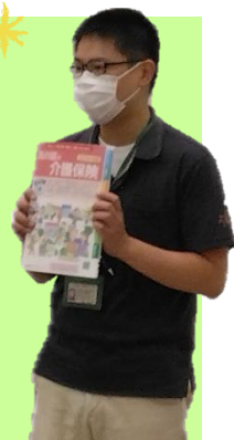
土山ケアマネジャー

※基本チェックリストとは、65歳以上の高齢者が自分の生活や健康状態を振り返り、心身の機能で衰えているところがないかどうかをチェックするためのものです。