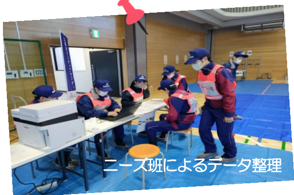
ニーズ班によるデータ整理

講師のAAR JAPANの堀尾氏からは「能登半島地震では、精神的に減入っている人も多い。ボランティア活動は、精神的な面でも支えになっていると思う。平時にできていないことは、災害時にもできない」とのお話がありました。区内での大規模災害発生に備え、引き続き、平時の準備を進めてまいります。