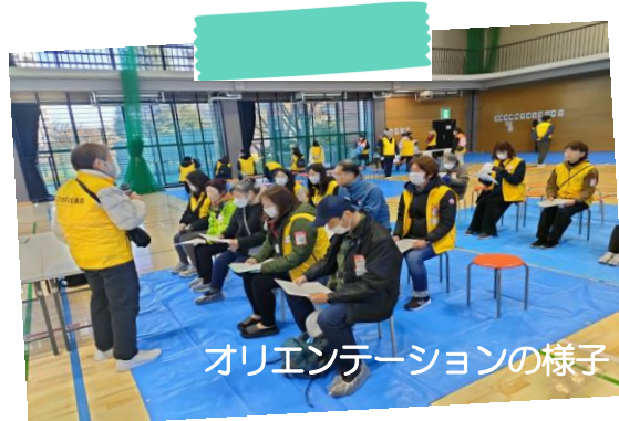
オリエンテーションの様子

12月8日（土）、中小企業センターのスポーツ室にて、災害ボランティアセンター設置運営訓練を区と合同で実施しました。今回の訓練では、ボランティア活動のインターネット事前予約や、ニーズ情報のクラウド管理を取り入れ、活動先地図の表示などでスマートフォンを活用しました。