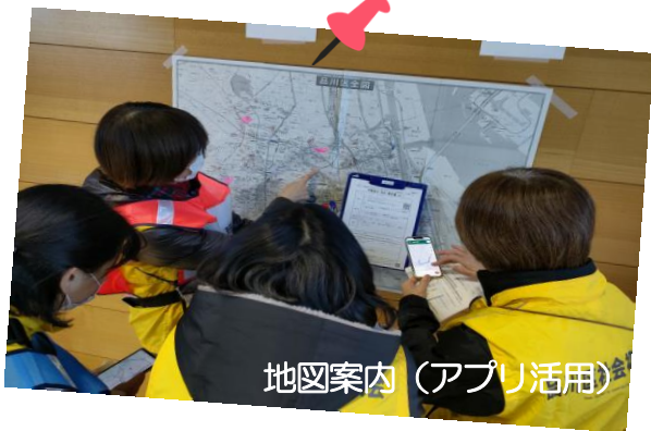
地図案内（アプリ活用）