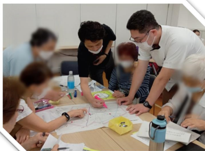
👉 グループワークの様子