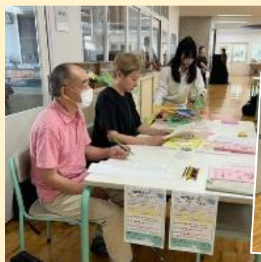
地域支援員さんが受付 生徒さんが席までご案内♪