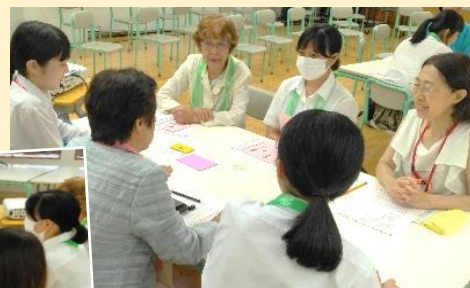
参加者名札やカードも 生徒がひとつずつ手作り！