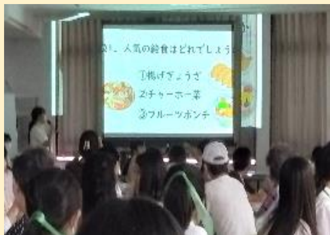
日野学園の人気メニューNo.1は「②チャーホーサイ」♡