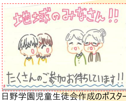
日野学園児童生徒会作成のポスター

品川区立日野学園の児童・生徒と地域の方との交流事業です。平成30年から始まり、コロナ禍もリモート開催、今年で6回目となりました！