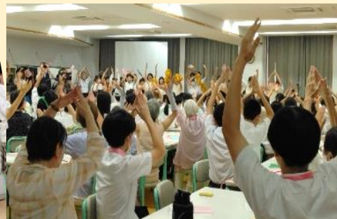
左:スペシャルゲスト「マツケン」登場!?(笑) 上:100名超によるY・M・C・Aは圧巻