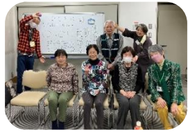
合言葉は「おさきに～♡」

毎月第4木曜日 14:00～15:00 大崎ゆうゆうプラザ (大崎2-7-13)