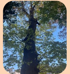
戸越八幡神社の ケンボナシ☆