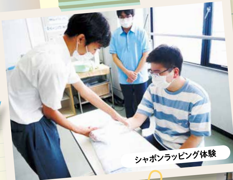
シャボンラッピング体験