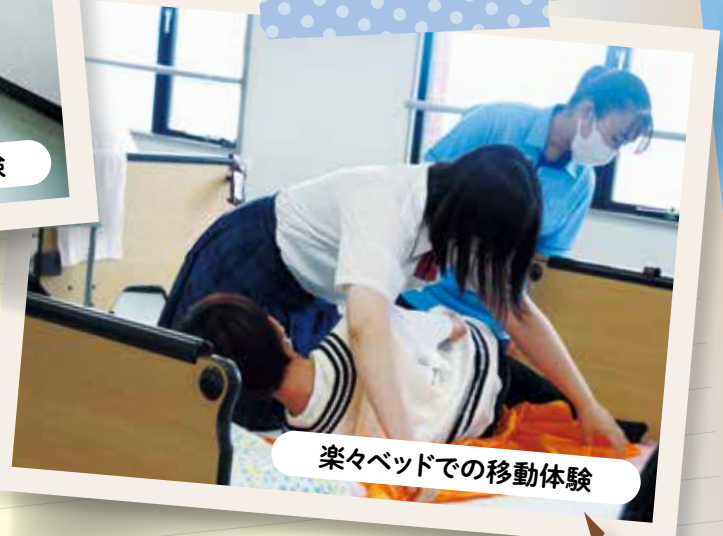
楽々ベッドでの移動体験