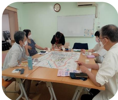
地域支援員同士で話し合いながら 「よりみち」を運営しています

日頃の活動の中で、地域支援員や支え愛職員が気づいた みんなで共有したいエピソードを紹介します♪