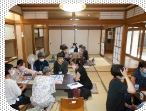
よりみちの会場になっている 「お寺」で交流会を開催。交流 もPRもできて一石二鳥！ 皆さんに知ってもらえてうれ しいな～。