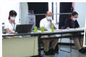
西大井在宅介護支援センター職員による講演

認知症について正しく理解し、認知症の方との接し方を学びました。これからも《市民後見人カフェ》を開催し、みんなの輪を広げていく予定です。