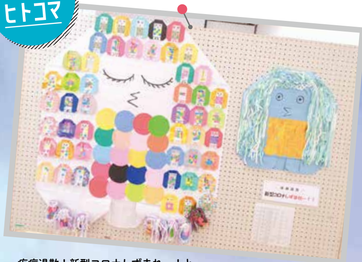
疾病退散！新型コロナはずまれー！と 思いを込めて R2 年度品川区障害者作品展に出展した作品です。 早く平穏な日々が送れますように。 にじのひろば 戸越

今年度は助成事業に力を入れつつ、皆様からの会費やご寄付を活用して、紙おむつ支給事業や、ひきこもり等若者支援事業、奨学研究資金の給付をはじめ、様々な事業を継続して、地域の明るいニュースのきっかけにつながればと考えております。引き続き品川区社会福祉協議会へのご支援をよろしくお願いいたします。