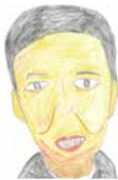
絵 / 西大井利用者さん