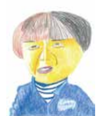
絵 / 西大井利用者さん