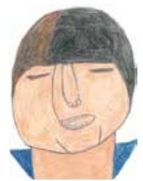
絵 / 西大井利用者さん