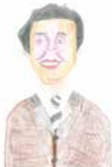
絵 / 西大井利用者さん

私が所属しているにじのひろばは、障がいのある小学生~高校生までを対象とし、放課後や長期休暇等のサポートを行っています。のびのびと自由に、自分のしたいことをする。成長と共にさまざまな表情を見せてくれる子供たちを“支援員”という立場からですが、そばで見守ることができるこの環境に喜びを感じています。これからも活動を通して、より多くの方々ににじのひろばを知っていただけたらと思います。いっぱい食べて子ども達のパワーに負けないよう頑張ります!