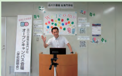
オンラインオープンキャンパスの様子

5月よりオンラインオープンキャンパスや施設見学会を実施しています。遠方の方や、「まずはどんな学校か知ってみたい」といった方から好評をいただいています。また、You tube チャンネルの充実を図り、来校しなくても学校の様子がわかる工夫をしています。