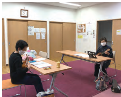
参加者同士の距離を取り活動します。