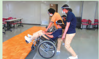
車いす操作の指導