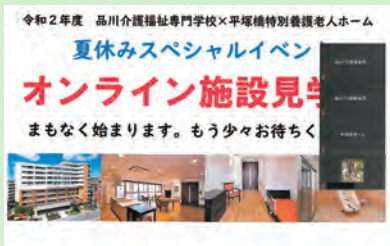
オンライン施設見学会のパソコン画面①