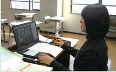
オンライン授業の様子