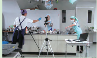
オンラインでの調理指導