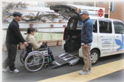
福祉車両を使った移動支援

ボランティアとして活動していただく協力会員のご登録もあわせてお待ちしております。