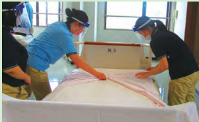
ベッドメイキングの指導