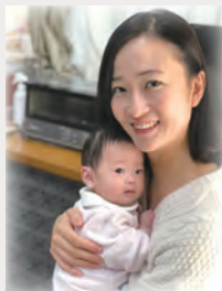
産前産後の家事支援