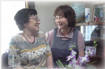
掃除・買い物・話し相手等の家事支援