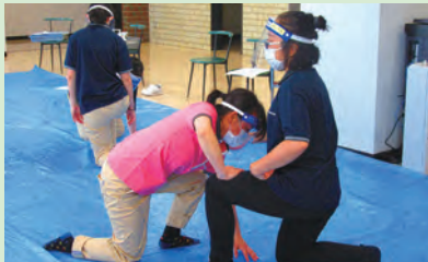
身体の起こし方の実技指導

対面授業の際には、学生の体温を学校エントランスにて確認しています。1学年を2グループに分けて、授業を行っています。授業の際には、フェイスシールドやマスクを着用しています。また、使用した机やイス、備品等は授業後に学生自身が消毒をしています。