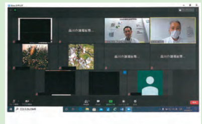
オンライン施設見学会のパソコン画面②