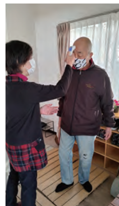
参加者全員検温を実施します。