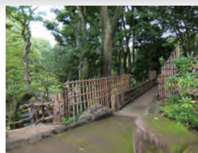
～今号の1枚(表紙写真)～ 戸越公園

大井営業所 品川区東大井5-25-19 TEL 03-3472-0990 (24時間受付)