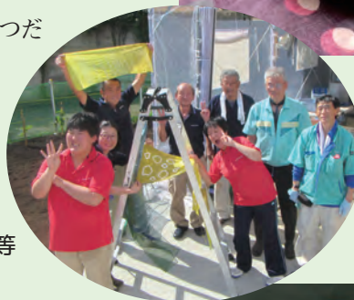
上：てぬぐい 中：みんなで染色作業 下：絹ストール、綿ストール