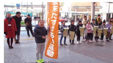
山中小学校と小山台小学校すまいるスクールの元気な子どもたち