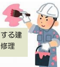
利用者が使用する建 物等の改修・修理